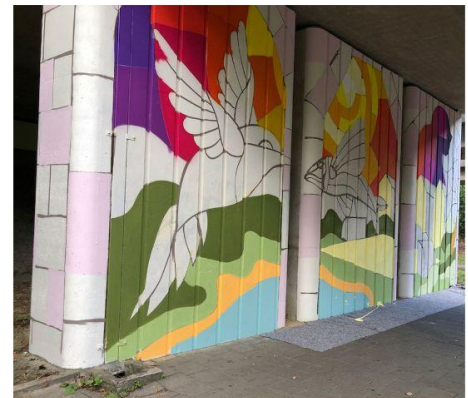
Zie hier een aantal foto's van de resultaten van Verf een Viaduct en de feestelijke opening 29 september.