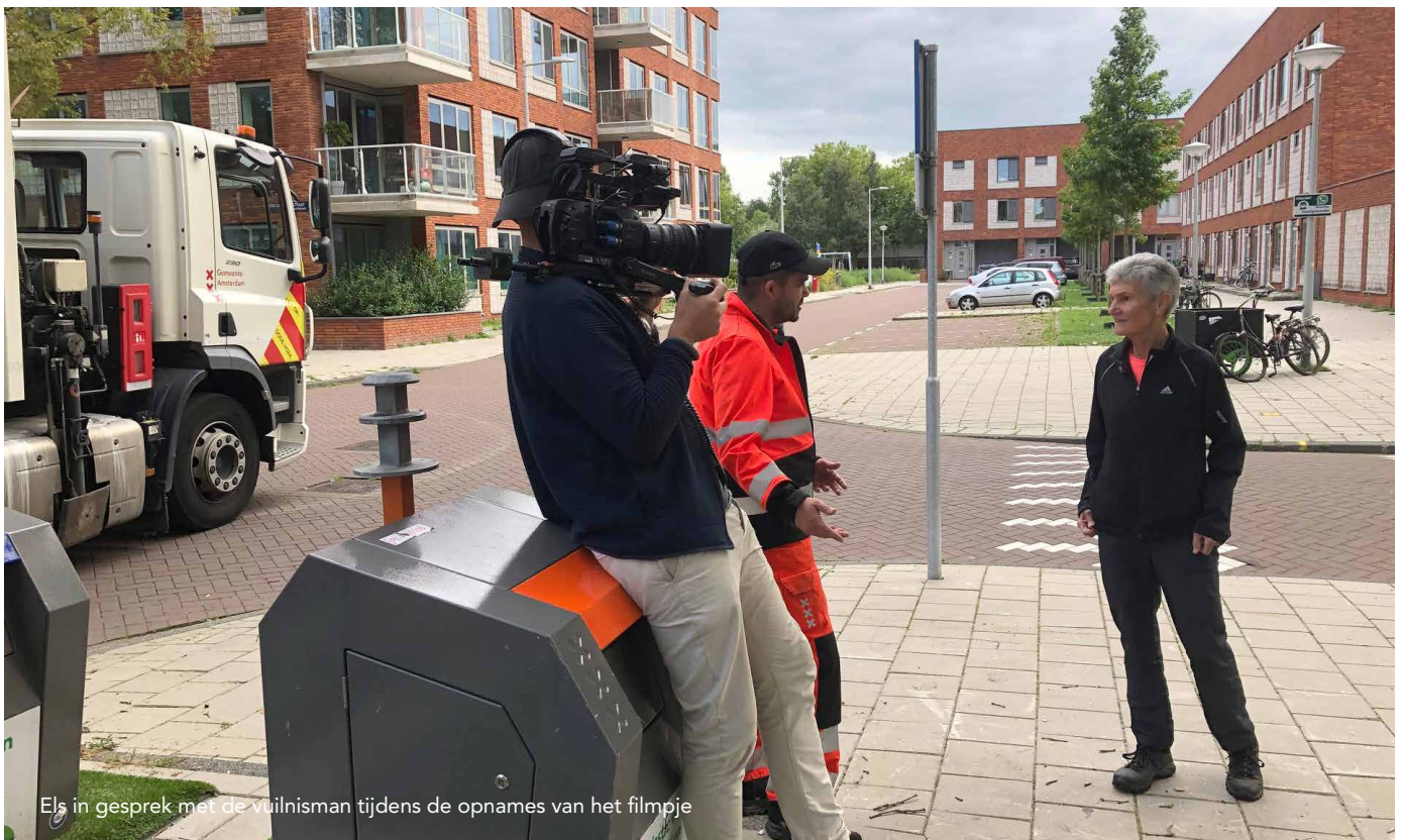
Els in gesprek met de vuilnisman tijdens de opnames van het filmpje

Ga naar amsterdam.nl/afval en klik op Grof afval . Het filmpje staat onder Regels voor grof afval .