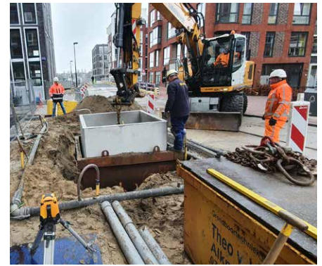
In de Houthavens in West plaatsen we containers voor nieuwe bewoners

Bij herinrichting en vernieuwing van straten en pleinen worden ook meteen nieuwe containers geplaatst. Hetzelfde geldt voor