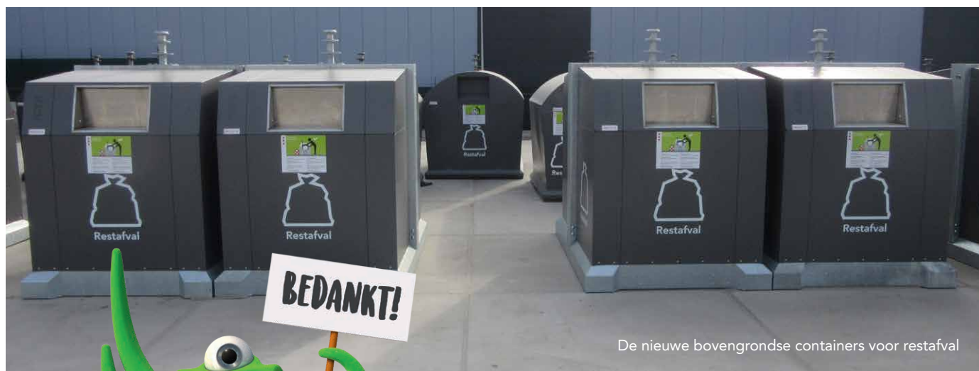
De nieuwe bovengrondse containers voor restafval

De oude bovengrondse containers die we weghalen, proberen we opnieuw te gebruiken. Zoals bij de plasticcontainers die we buurt voor buurt weghalen omdat we plastic niet meer gescheiden ophalen. Deze containers maken we schoon, we halen de stickers eraf en verven 'm in de juiste kleur. Daarna gaat er een sticker voor restafval op. De nieuwe bovengrondse containers zijn binnenkort op verschillende plekken in de stad te zien.