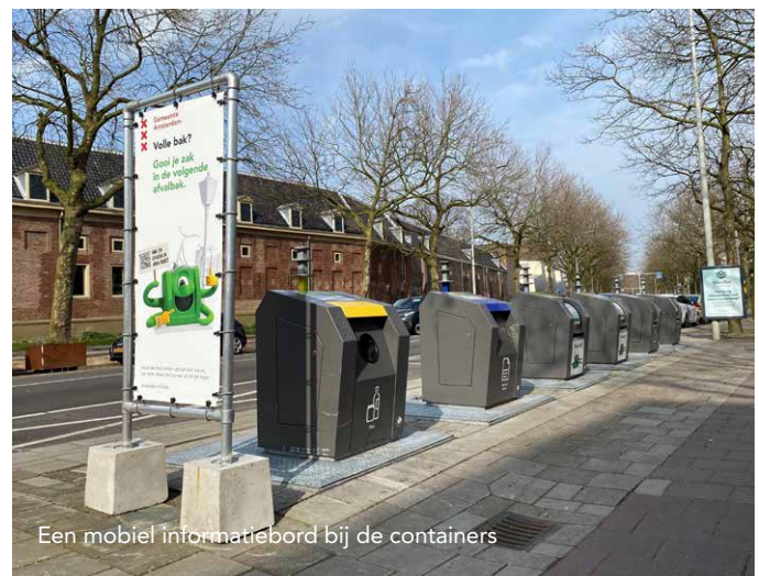
Een mobiel informatiebord bij de containers

We zijn erg blij met u als containeradoptant. Mede dankzij u is de stad schoner en leefbaarder. Samen houden we Amsterdam schoon.